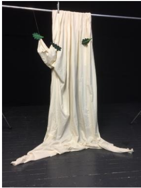
Boom van lappen

1. Activiteit in groepjes van 3 - 5 leerlingen: In de voorstelling maken de acteurs van lappen verschillende plekken. Kunnen jullie dat ook?